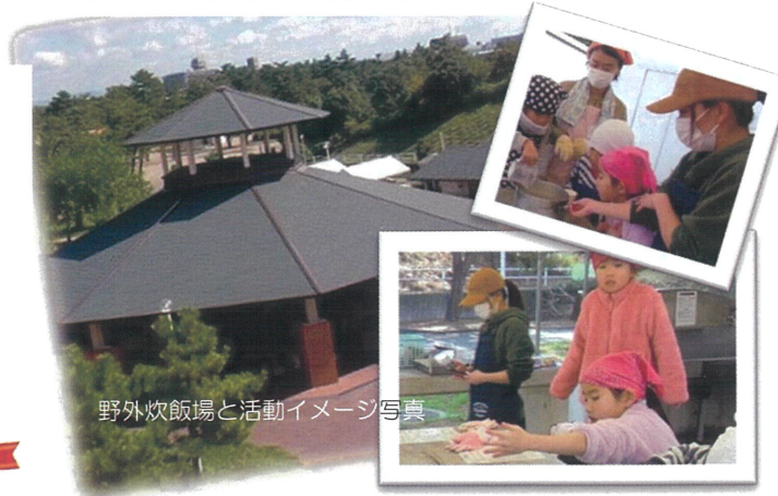
野外炊飯場と活動イメージ写真